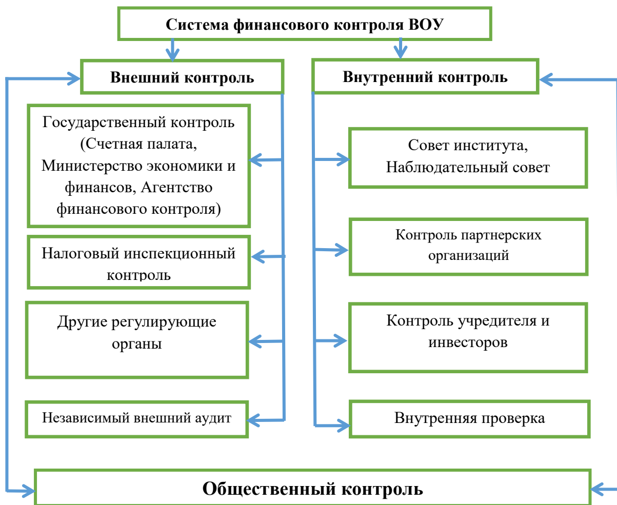
Рис. 1. Предложенная типовая схема организации финансового контроля в высших образовательных учреждениях 10

Выяснилось, что только ТИУ ТИИИМСХ, НТУ, ТФИ, АндИЭИ имеют некоторую финансовую информацию на своих официальных сайтах. Сегодня предлагаемая схема финансового контроля (рис. 1) служит реализации принципов открытости, прозрачности и справедливости, установленных нашим правительством. Потому что организация финансового контроля за бюджетными средствами в каждом государственном учреждении, особенно общественного контроля, заставляет каждого руководителя думать и размышлять о расходуемых им средствах и осуществлять только самые необходимые расходы. Не допускается произведения чрезмерных затрат. Для этого каждое высшее образовательное учреждение должно быть обязано регулярно размещать финансовую информацию (смету расходов, фактические расходы и доходы) на своем официальном сайте. В результате работа будет продолжена как по законным, так и по справедливым принципам.