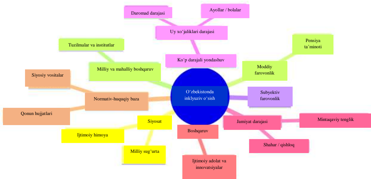
3-rasm. O‘zbekistonda inkluziv o‘shni oshirish mexanizmi omillari 11

O‘zbekistonda jadal o‘shni oshirish mexanizmini amalga oshirishda, maxsus davlat dasturi va yo‘l xartisini ishlab chiqishda quyidagilarni hisobga olish kerak: