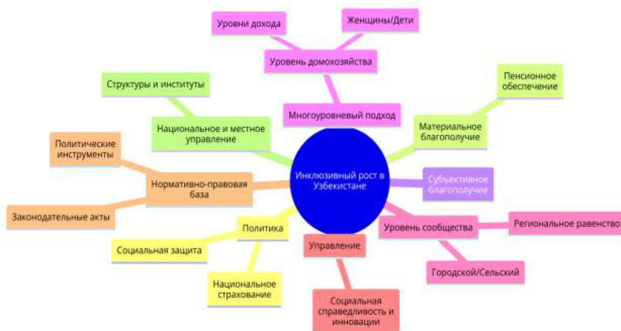
Рис. 3. Факторы механизма увеличения инклюзивного роста в Узбекистане 10

С помощью рисунка мы отобразили механизм увеличения интенсивного роста в Узбекистане. Если будет достигнуто развитие этих 9 групп факторов, то можно добиться экономического роста в стране с доминированием интенсивных факторов над экстенсивными. Это, в свою очередь, служит важным шагом в достижении целей ООН в области устойчивого развития.