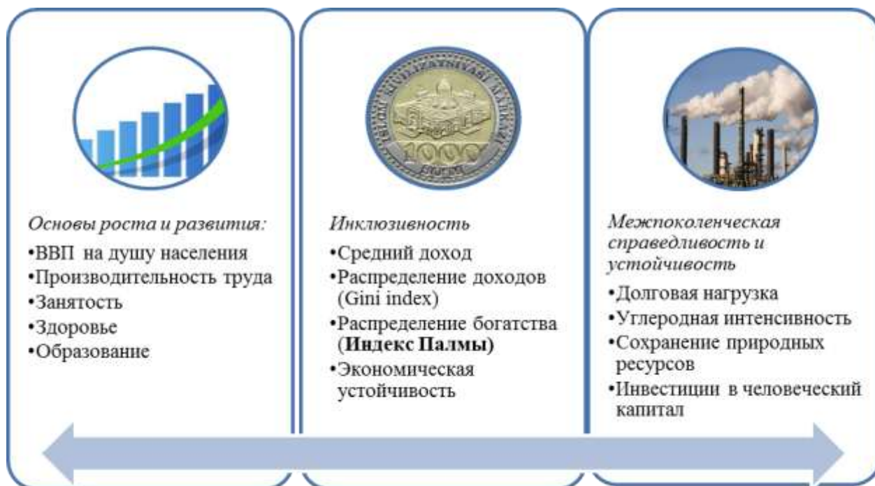
Рис. 1. Показатели индекса инклюзивного развития 5

В отличие от индекса инклюзивного развития ВЭФ добавлен 5, изменены 9, 13 индексы. Из показателей каждой группы рассчитываются сначала групповые индексы, а затем складывается итоговый – их среднее арифметическое.