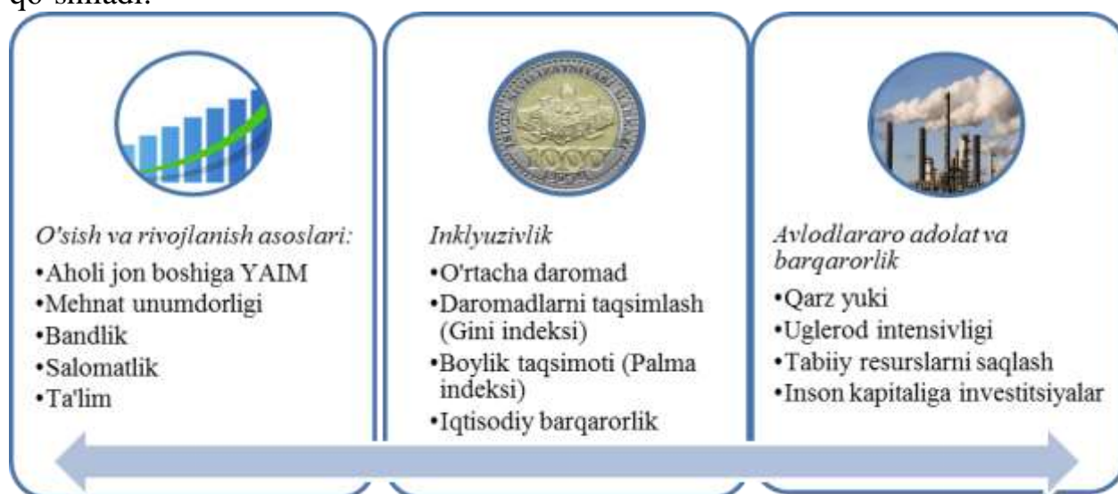
1-rasm. Inklyuziv rivojlanish indeksining ko'rsatkichlari 6

JIF inklyuziv rivojlanish indeksidan farqli o'laroq 5-indeks qo'shildi, 9-, 13-indekslari o'zgartirildi. Har bir guruhning ko'rsatkichlaridan avval guruh indekslari hisoblab chiqiladi, so'ngra yakuniy – ularning arifmetik o'rtacha qiymati qo'shiladi.