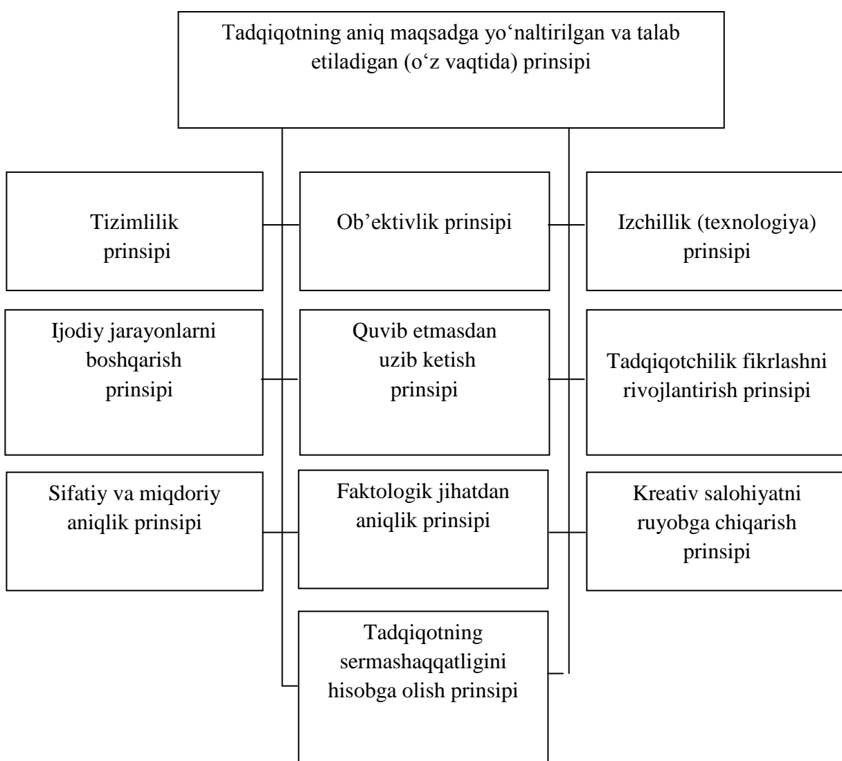
2-rasm. Samarali boshqaruv prinsiplari

Samarali boshqaruv prinsiplari 2-rasmda keltirilgan.