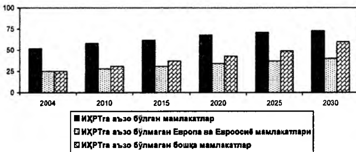
2-расм. Жаҳон мамлакатларида табиий газ истеъмоли прогнозлари, (трлн. куб фут) 13

Уларда 2004 йилда табиий газ қазиб олиш ҳажми 26,9 трлн. куб футни ташкил этган. Тарихан АҚШ ушбу минтақада энг йирик табиий газ ишлаб чиқарувчи ва уни истеъмоли қилувчи мамлакат бўлиб келган. 2004 йилда ушбу мамлакатда 19,0 трлн. куб фут табиий газ қазиб олинган бўлса, бу кўрсаткични 2030 йилга бориб, 20,7 трлн. куб футга етказиш режалаштирилган. Мамлакатнинг кўпласи конларида табиий газ ноанъанавий усулда қазиб олинади.