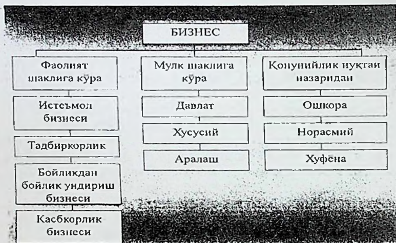
1.1.1-расм. Бизнес шакллари.

Бизнинг фикримизча, бизнес фойда, даромад, наф олишга қаратилган иқтисодий фаолият юзасидан кишилар ўртасида юз берадиган ижтимоий-иқтисодий муносабатлар мажмуасидир. Тадбиркорлик бизнеснинг муҳим таркибий қисми, юз бериш шаклларида бири бўлиб, товар ишлаб чиқариш ва хизмат кўрсатиш орқали фойда, даромад олишга қаратилган фаолиятдир. Демак, бизнес кенгроқ маънога эга бўлиб, тадбиркорлик унинг бир шакли ҳисобланади 1 (қаранг: 1.1.1-расм).