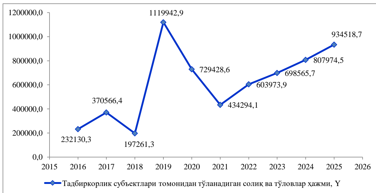
2-расм. 2022-2025 йилларда тадбиркорлик субъектлари томонидан тўланувчи солиқларнинг прогноз қийматлари 15

“Имом Бухорий” мажмуаси атрофида фаолият юритаётган тадбиркорлик субъектлари томонидан тўланувчи солиқларнинг 2022-2025 йиллардаги прогноз кўрсаткичларига кўра, 2025 йилда умумий овқатланиш шохобчалари томонидан тўланувчи солиқлар ҳажми (X1) – 14 302,4 минг сўмга, савдо шохобчалари томонидан тўланувчи солиқлар ҳажми (X2) – 69 190,6 минг сўмга, жойлаштириш воситалари томонидан тўланувчи солиқлар ҳажми (X3) – 34 538,2 минг сўмга, туризм ташкилотлари сони (X4) – 364 тага, ташриф буюрувчилар сони (X5) – 1 368,8 минг кишига ошиши кутилмоқда.