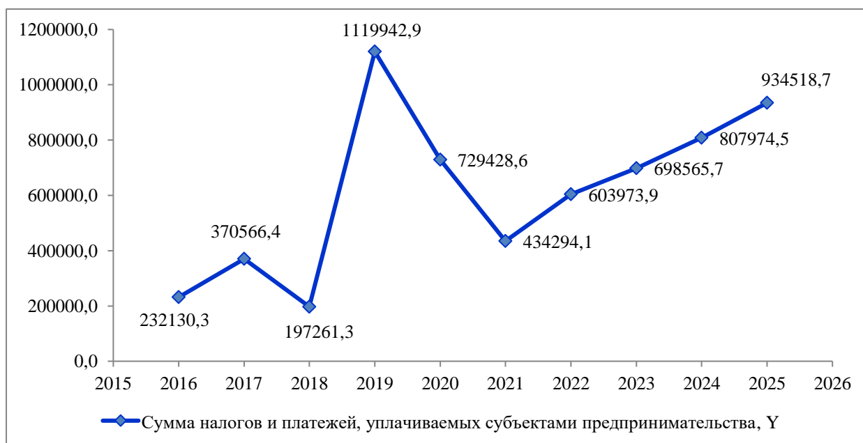
Рис.2. Прогнозные значения налогов, уплачиваемых субъектами предпринимательства в 2022-2025 годах 15

Исходя из вышесказанного, с использованием эконометрической модели была разработана прогнозная величина налогов, которые в 2022-2025 годах должны быть уплачены в государственный бюджет субъектами предпринимательства, расположенными вокруг комплекса «Имам Бухари».