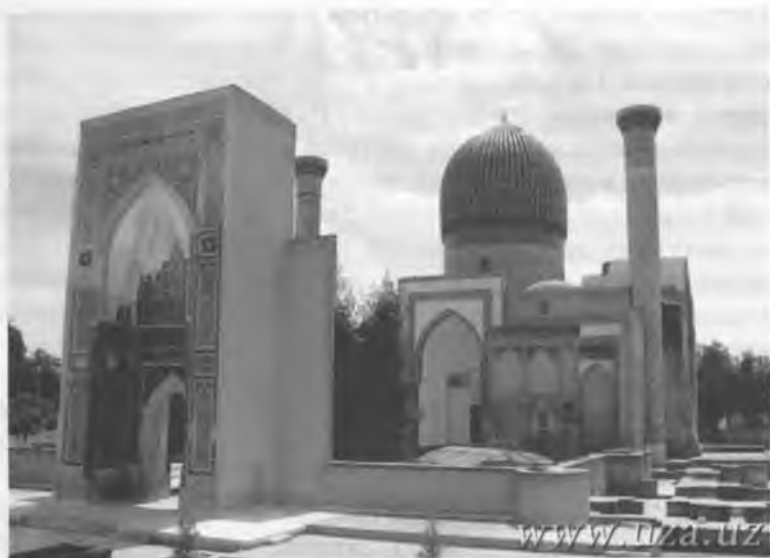
Рис.9. Мавзолей Амира Тимура в Самарканде.