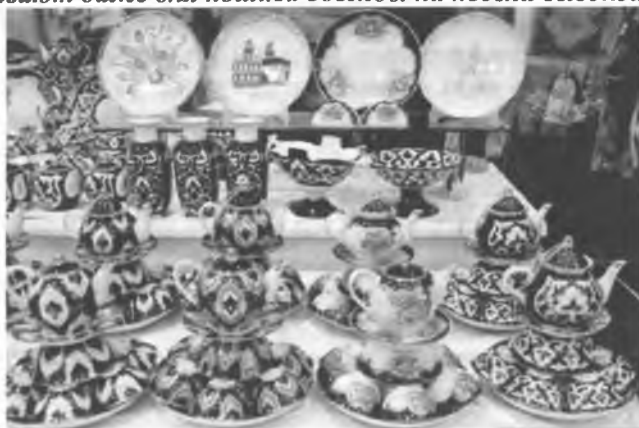
Рис.12. Фарфор из местного сырья.