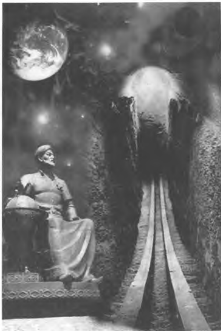
Рис.8. Обсерватория Улугбека.