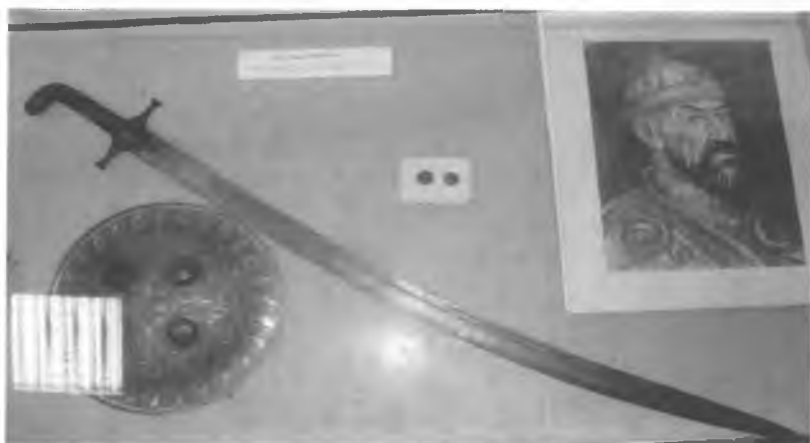
Рис.3. Сабля и щит Амира Тимура.