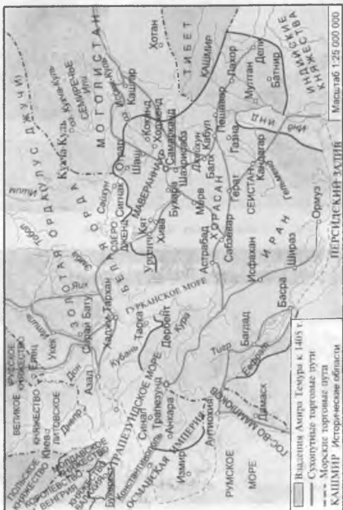
Рис. 2. Карта государства Амира Тимура.