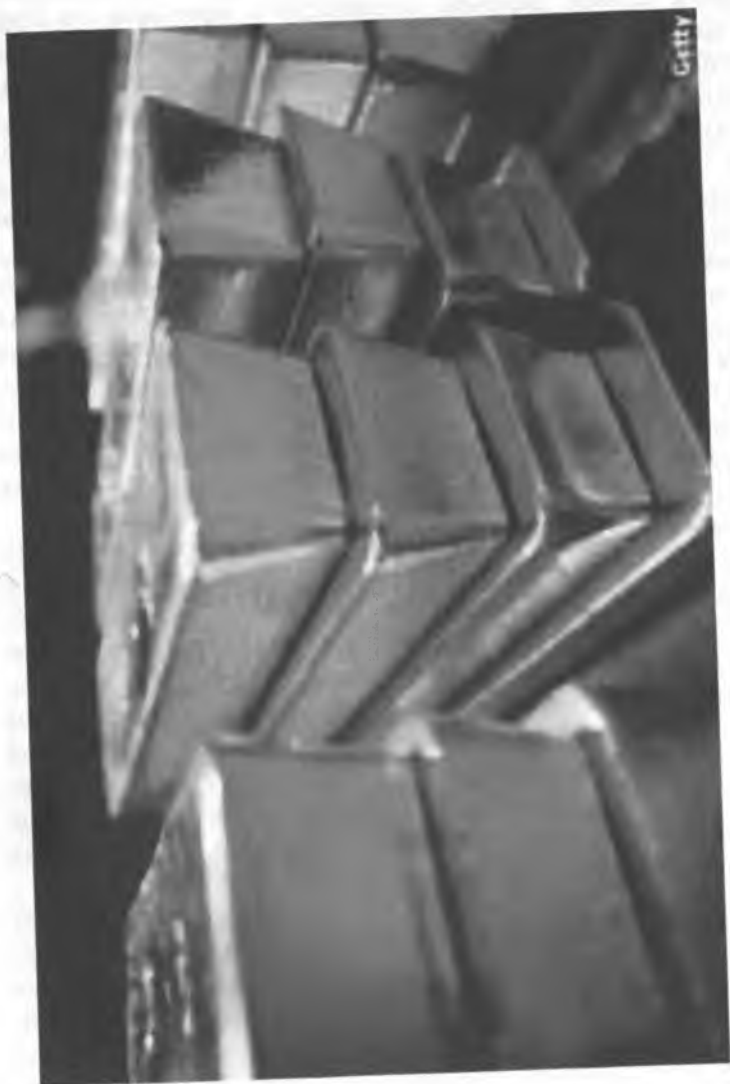
Рис. 17. Золото Узбекистана.