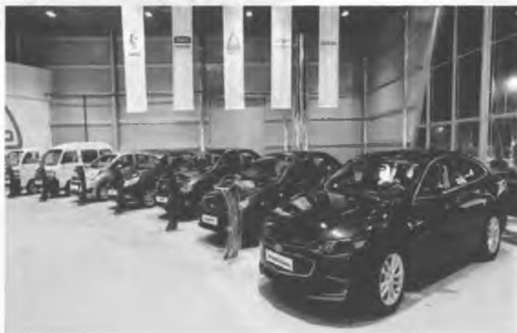
Рис.14. Совместное предприятие General motors GM Uzbekistan.