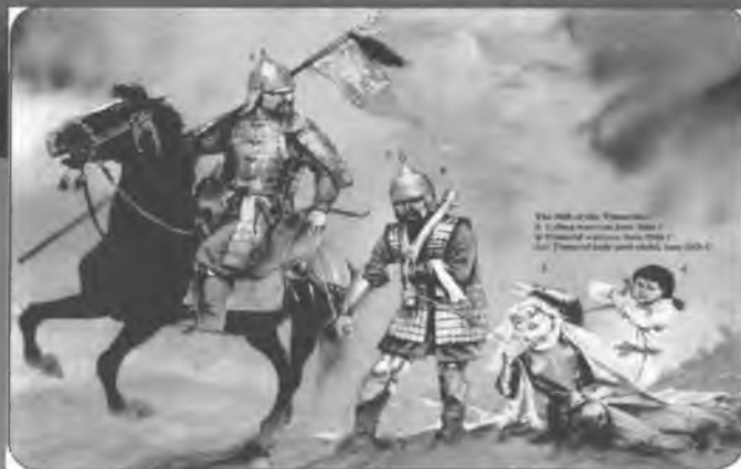
Рис.4. Кочевой узбек и тимуриды.