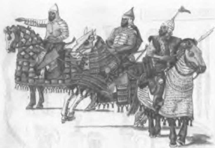
Рис.5. Воины армии Амира Тимура во время боя.