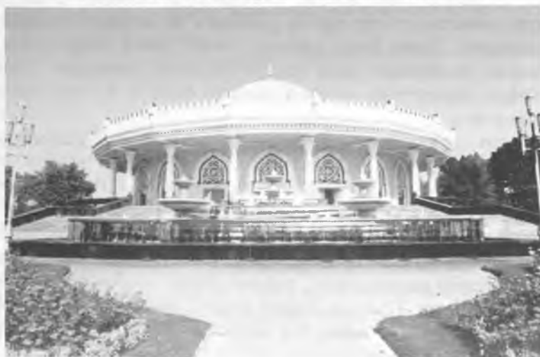
Рис.10. Музей Тимуридов в Ташкенте.