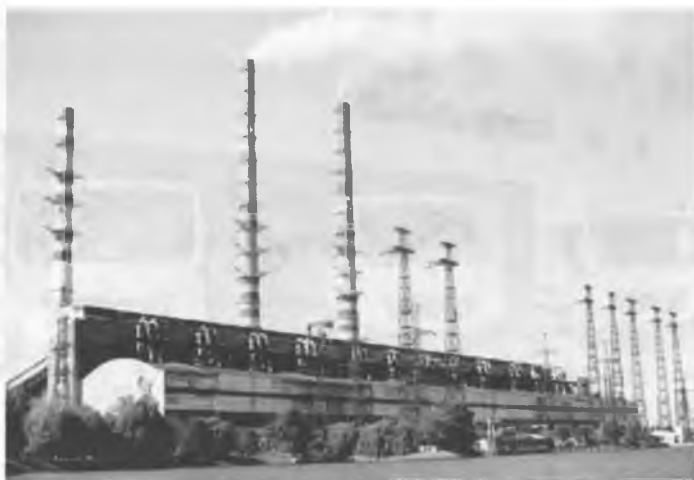
Рис.13. Сырдарьинская ТЭС вырабатывает до 3000 МВт энергии.