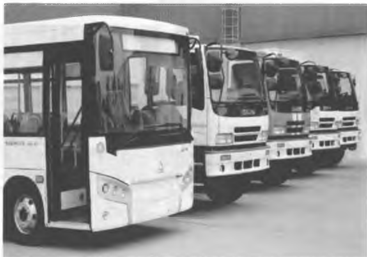
Рис. 16. Совместное предприятие СамАвто.