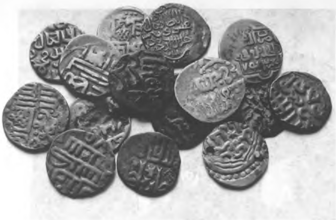
Рис 7. Монеты периода Тимуридов.