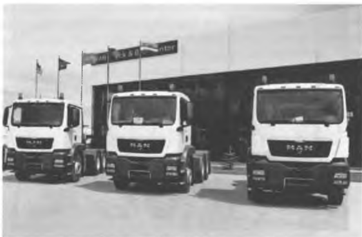
Рис. 15. Совместное предприятие JV MAN Auto-Uzbekistan.