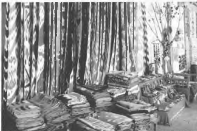
Рис.11. Ткани из шелка высоко ценятся во всем мире: их заказывают даже для пошива одежды на недели высокой моды.

комбинат, Наманганский и Алмалыкский химзаводы, Ташкентский химико-фармацевтический завод и др. К строительству начала формирования этой отрасли на его структуру оказала влияние тех лет относится Кызылкумсий фосфоритный комбинат, Кунградский содовый завод, производилась реконструкция других химзаводов.