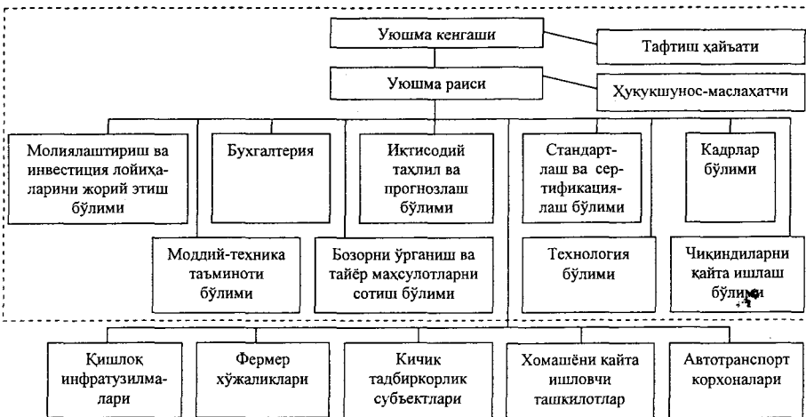
2-расм. Ҳудудда деҳқончилик маҳсулотларини ишлаб чиқиш, қайта ишлаш ва сотишга ихтисослашган фермер хўжалиklarи кооперациясига асосланган уюшма бошқарувининг ташкилий тузилмаси*

Ўқорида таъкидланганидек, фермер хўжалиklarида тез бузулувчи, махсус транспортда ташиш имконияти чекланган маҳсулотларни ишлаб чиқариш ҳажми кўпаймоқда. Шунини ҳисобга олиб, илмий ишда тез бузулувчи деҳқончилик маҳсулотларини ишлаб чиқиш, қайта ишлаш ва сотишга ихтисослашган кооперацияга асосланган фермер хўжалиklarи уюшмаси бошқарувининг ташкилий тузилмаси таклиф этилган (2-расм).