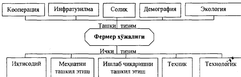
1-расм. Фермер хўжалиги ишлаб чиқариш фаолиятини бошқаришнинг ички ва ташки тизимлари*

Фермер хўжалигининг ички тизими техник, технологик ва ишлаб чиқаришни, меҳнатни ташкил этиш, иқтисодий тизимлардан ташкил топган бўлади. Барча тизим унсурлари ўзаро бир-бирига боғлиқдир. Уларнинг биргаликдаги ҳаракати хўжаликнинг ягона тизим тарзида мавжудлигини кўрсатади. Бозор иқтисодиёти шароитида ҳар бир корхона, ташкилот очик тизим кўринишида фаолият кўрсатади. Хусусан, фермер хўжалиги ҳам бундан мустасно эмас. Сабаби фермер хўжалигининг истиқболлини ва ривож топишини кооперацияга асосланган уюшма (бирлашма), агрофирмалар ва турли хизматлар кўрсатувчи бозор инфратузилмаларисиз тасаввур этиш қийин. Уларни фермер хўжалиги фаолиятига таъсир этувчи ташки тизим деб караш мумкин (1-расм).