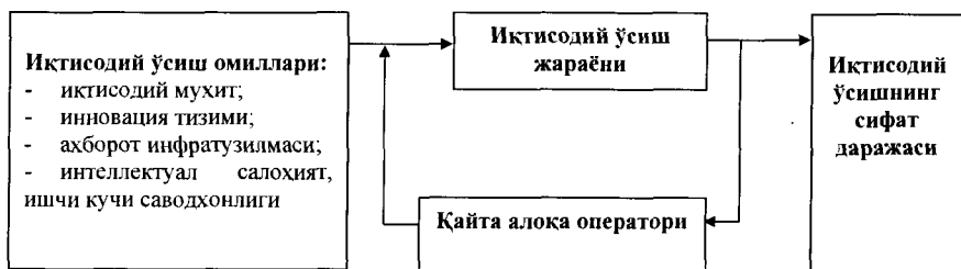
5-расм. Иктисодий ўсиш жараёни ва унга таъсир этувчи омиллар

Иктисодий ўсиш жараёнига тўрт тоифадаги омиллар таъсир кўрсатади ва натижа-иктисодий ўсишнинг сифат даражаси ҳар бир омил ва омиллар комбинациясига боғлиқ бўлади (5-расм). Бу жараённи тизим тарзида «сабаб ва оқибат» шаклида математик моделлар тизими орқали ифодалаш мумкин.