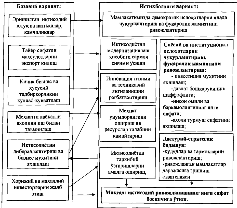
3-расм. Ўзбекистонда таракқиётнинг сифат даражасини ошириш модели

Ўзбекистон Республикасининг инновацион таракқиётга йўналтирилган модели умумий стратегиясининг бир қисми – ахборот технологиялари соҳаси технопаркларини яратиш ҳисобланади. Ҳар битта технопарк таркиби офис бинолари ва мутахассислар фаолияти учун зарур барча инфратузилма қулайликларига эга мажмуадан иборат бўлади (3-расм).