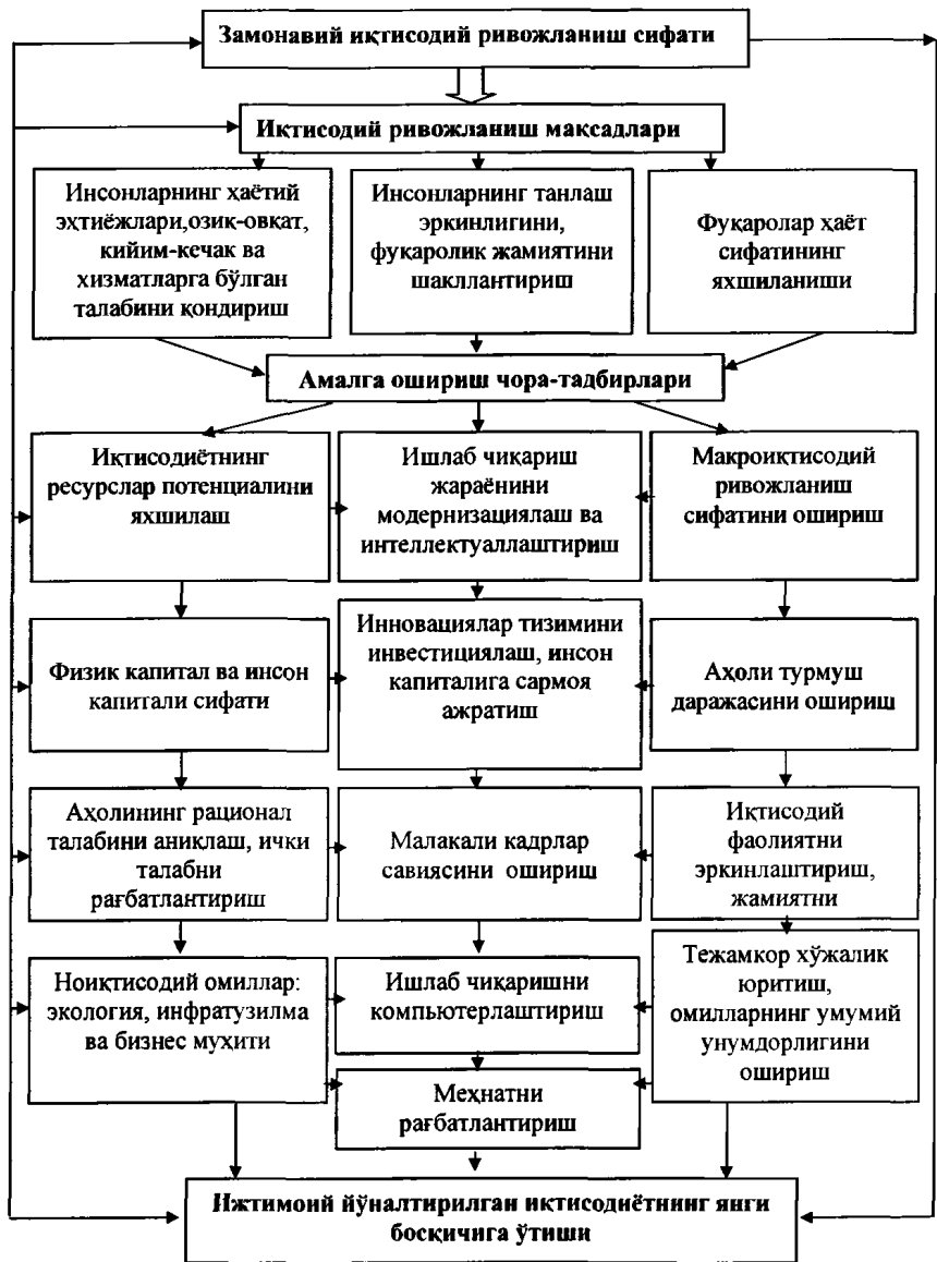
2-расм. Замонавий иқтисодий ривожланиш сифатининг таркибий тузилмаси