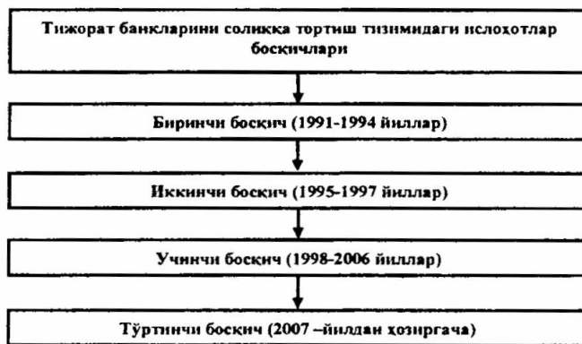
3-расм. Тижорат банкларини солиққа тортишни ривожлантириш босқичлари 6

Мамлакатда солиқ сиёсати мустақиллик йилларида босқичма-босқич давомийлик касб этган ҳолда амалга ошириляпти. Тадқиқот ишида республикада тижорат банкларининг солиққа тортиш механизмидаги ислохотлар куйидаги тўрт босқичга ажратилган ҳолда таҳлил этилган, (3-расм).