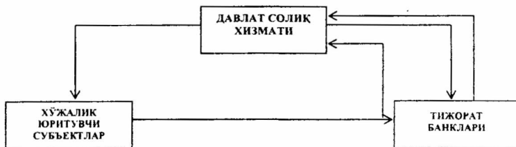
1-расм. Тижорат банкларининг бошқа хўжалик юритувчи субъектлари солиқларини ундиришдаги роли 4

Тижорат банкларини солиққа тортиш, бошқа хўжалик юритувчи субъектлардан фарқли ўлароқ, ўзига хос хусусиятларга эга. Тижорат банкларининг солиқ тизимида ўзига хослик иккита бир-бирига мос бўлмаган ҳолатда намоён бўлади. Биринчидан, тижорат банклари солиқ тўловчилар билан давлат ўртасида солиқлар ундирилиши ва уни назорат қилиш юзасидан воситачи ҳисобланади. Иккинчидан, тижорат банклари бир қатор солиқларни тўловчилари бўлиб ҳисобланади. Тадқиқот ишида ушбу жараёнлар қуйидаги расмда тасвирлаб берилган, (1-расм).