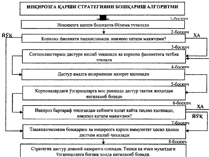
3-расм. Инқирозга қарши бошқариш бўлимида соғломлаштириш стратегиясини бошқариш алгоритми 20

Мазкур бошқарув тузилмасида инқирозга қарши бошқарув стратегиясини қуйидаги алгоритм асосида бошқариш тавсия этилади (3-расм).