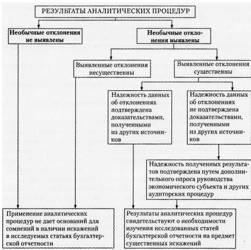
Рис. 5.2. Схема анализа результатов выполнения аналитических процедур

Результаты анализа необычных отклонений, а также результаты планирования и выполнения аналитических процедур аудитор должен отразить в рабочей документации по проведению проверки. Схема анализа результатов выполнения аналитических процедур приведена на рис. 5.2.