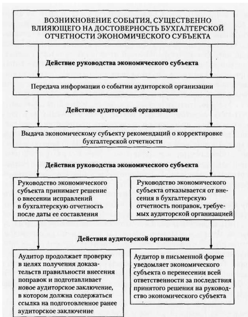
Рис. 5.3. Последовательность действий сторон при возникновении существенных событий после даты подписания аудиторского заключения, но до даты представления бухгалтерской отчетности пользователям

Однако необходимость в пересмотре финансовой отчетности и выдаче нового аудиторского заключения может не возникнуть, если приближается дата опубликования финансовой отчетности за следующий период, при условии, что в новой отчетности будет раскрыта соответствующая информация.