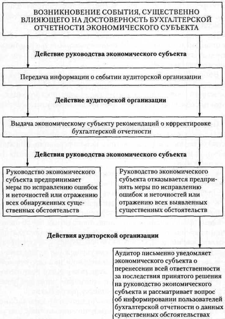
Рис. 5.4. Последовательность действий сторон при возникновении существенных событий после даты подписания аудиторского заключения и представления бухгалтерской отчетности пользователям

Разделом «Открытое размещение ценных бумаг» предусмотрено, что аудитор должен принять во внимание законодательные и связанные с ними требования, предъявляемые к аудитору во всех юрисдикциях, где имеет место размещение ценных бумаг. Например, от аудитора