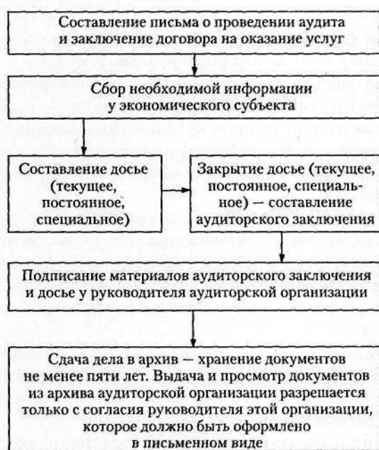
Рис. 2.2. Схема документирования в аудите

Ведущий аудитор в первую очередь уточняет программу аудита с учетом особенностей предстоящих аудиторских услуг.