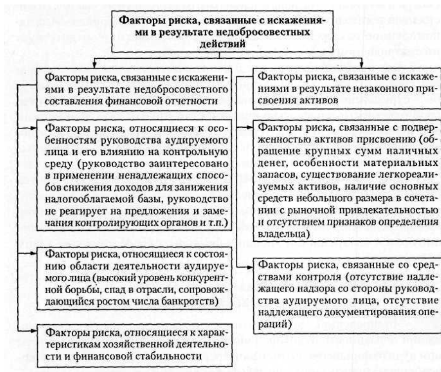
Рис. 2.3. Факторы риска, связанные с искажениями в результате недобросовестных действий

На основе МСА 240 разработано ПСАД № 13 «Обязанности аудитора по рассмотрению ошибок и недобросовестных действий в ходе аудита». Согласно Уголовному кодексу Российской Федерации мошенничество является одним из видов уголовных преступлений, в связи с чем квалифицировать некоторое деяние как мошенничество может только суд или следствие, но никак не аудитор. Поэтому в отечественном стандарте речь идет не о мошенничестве и ошибках, а о преднамеренных и непреднамеренных искажениях отчетности. Факторы риска, связанные с искажениями в результате недобросовестных действий, приведены на рис. 2.3.