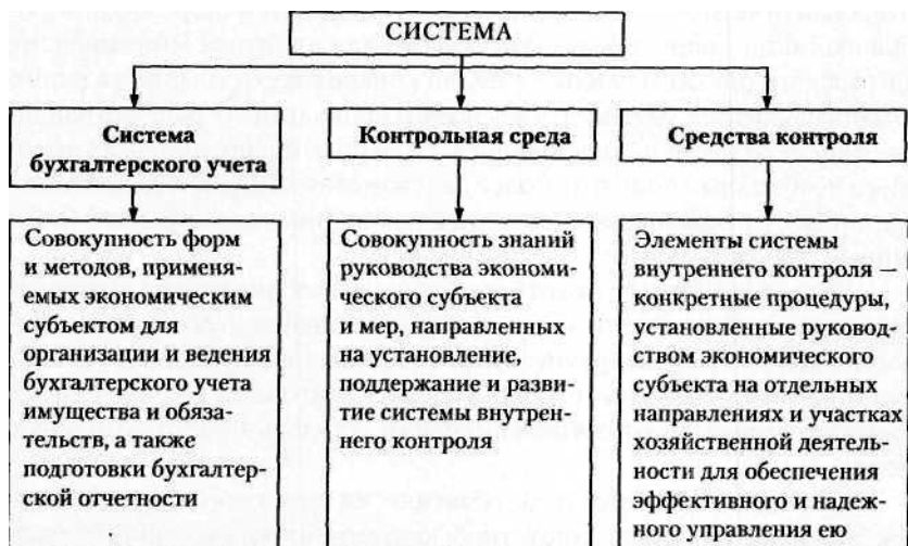
Система внутреннего контроля

верной финансовой (бухгалтерской) отчетности. Система внутреннего контроля может быть представлена в виде схемы (см. рис.).