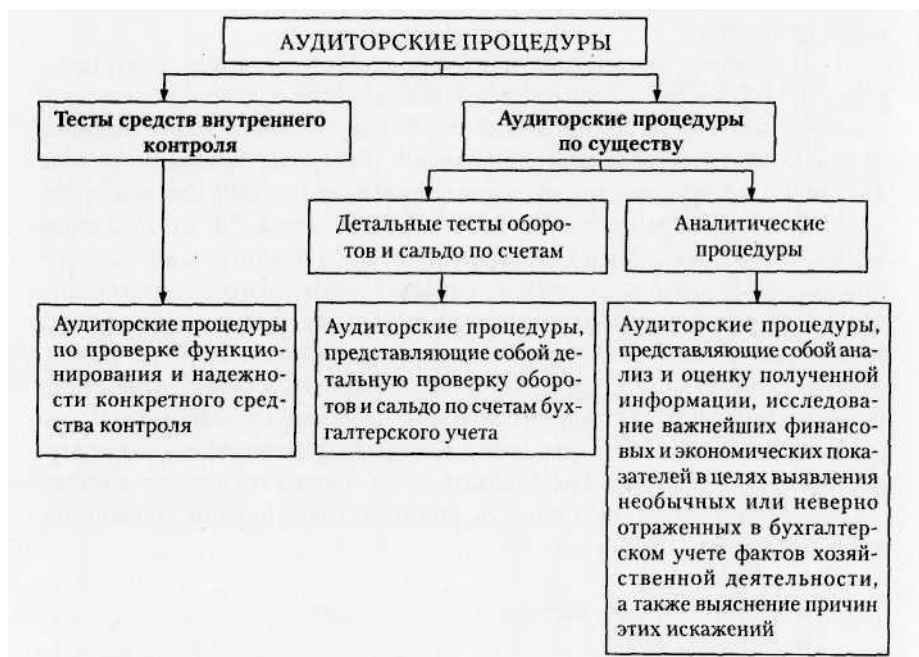
Рис. 5.1. Аудиторские процедуры

Аудиторские доказательства получают в результате комплекса тестов средств внутреннего контроля и необходимых процедур проверки по существу (рис. 5.1). В некоторых ситуациях доказательства могут быть получены исключительно путем проведения процедур проверки по существу.