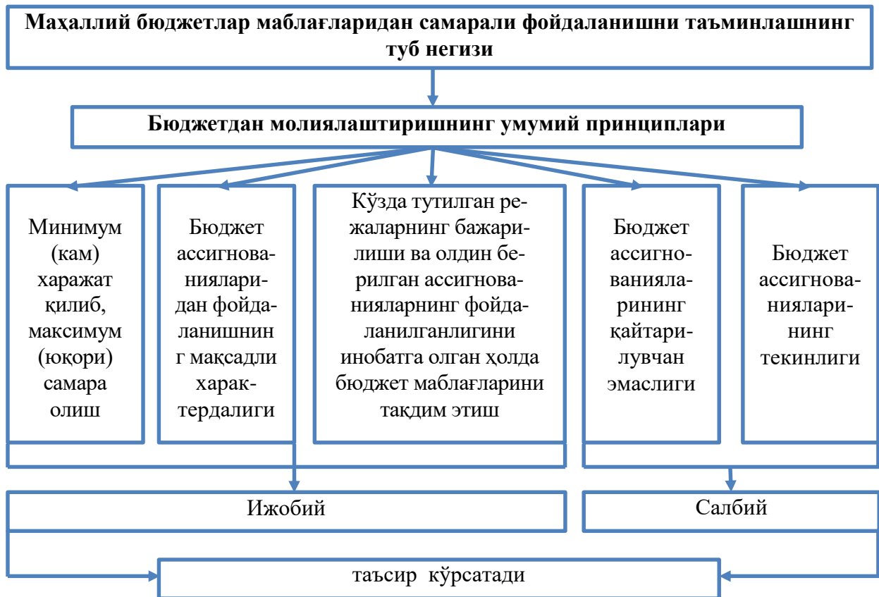
1-расм. Маҳаллий бюджетлар маблағларидан самарали фойдаланишни таъминлашнинг туб негизи ва унинг оқибатлари 2

ўзининг етарли даражадаги асосига эга эмас.