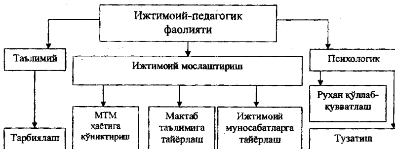
1-расм. Тарбиячиларнинг ижтимоий-педагогик фаолияти йўналишлари

“Мақтабгача таълим” йўналиши талабаларини ижтимоий-педагогик фаолиятга тайёрлашда куйидаги йўналишлар устуворлик касб этади (1-расм):