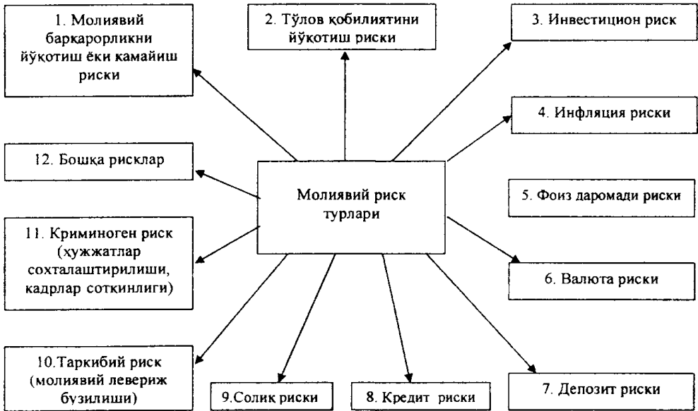
1-расм. Молиявий риск турлари 12 .

воқеалар билан боғлиқ бўлади” 10 , деб изоҳлайди. Е.С.Стоянова эса, “риск — бу режалаштирилган вариантга нисбатан даромад ололмаслик ёки зарар кўриш эҳтимолидир” 11 , деб таъриф беради.