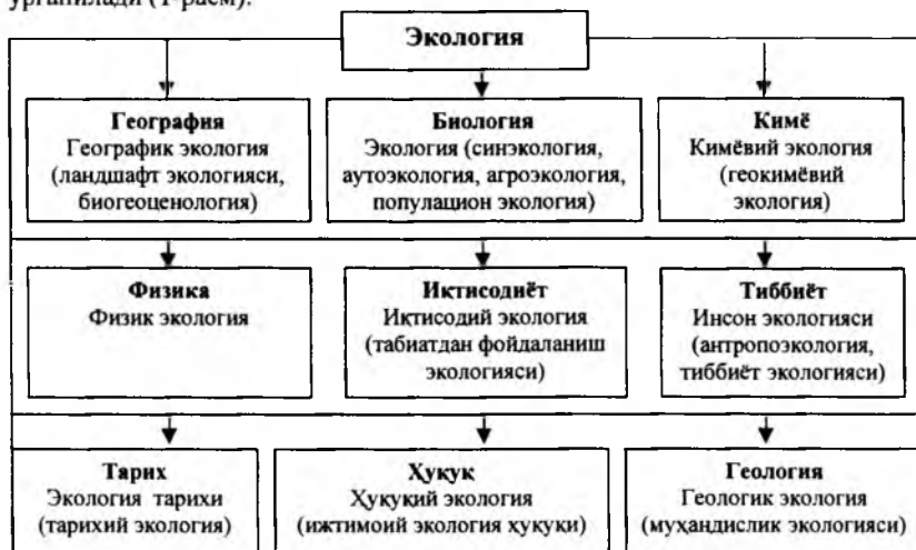
1-расм. Экология фанини фанлараро алоқадорликда ўрганиш модели

Касб-хунар коллежларида экология ва атроф муҳитни муҳофаза қилишга оид ўқув фанлари умумқасбий интегратив курс сифатида мазмунан эгалланаётган касб (мутахассислик) ва фанлараро нуктаи назардан ўрганилади (1-расм).