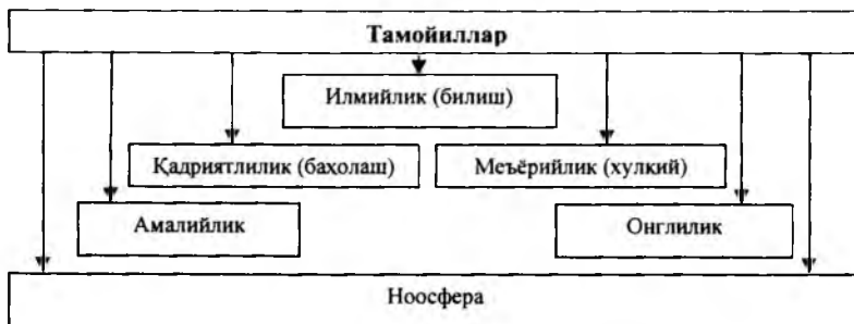
2-расм. Экологик таълимнинг устувор тамойиллари

Биз тадқиқот мобайнида экологик таълимнинг қўйидаги устувор тамойилларига асосланиб иш олиб бордик (2-расм).