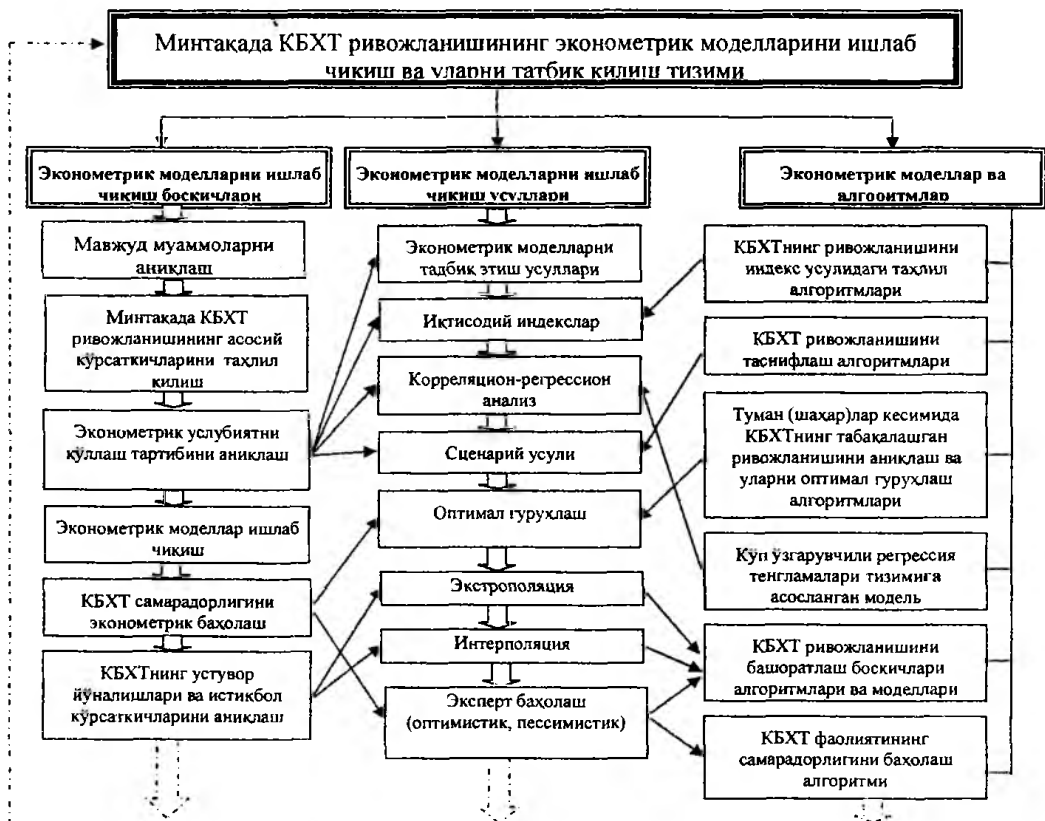
2-расм. Минтақада КБХТ ривожланишининг эконометрик моделларини ишлаб чиқиш ва уларни татбиқ қилиш тизими 17