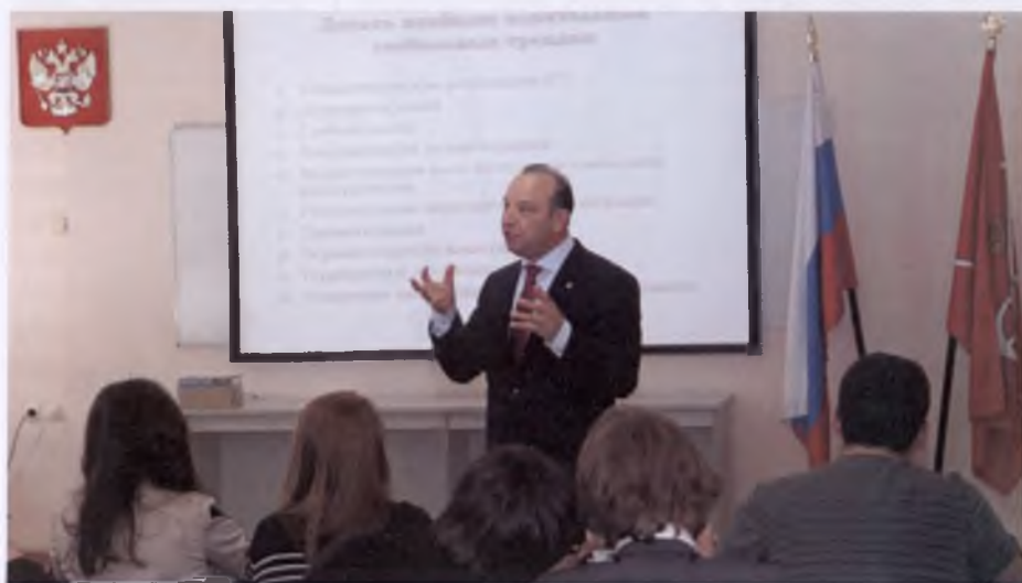
Открытая лекция академика В. Л. Квинта в Северо-Западном институте управления