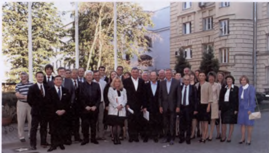
Встреча представителей Правительства Санкт-Петербурга с преподавателями кафедры стратегии, территориального развития и качества жизни Северо-Западного института управления