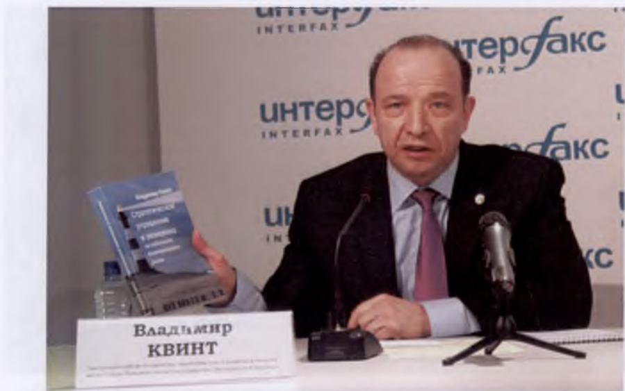
Пресс-конференция, посвященная выходу книги «Стратегическое управление и экономика на глобальном формирующемся рынке»