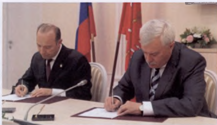
Подписание соглашения о сотрудничестве в рамках Петербургского экономического форума между Правительством Санкт-Петербурга и Гильдией стратегов. (Справа — Губернатор Санкт-Петербурга Г. С. Полтавченко, слева — Президент Гильдии стратегов В. Л. Квинт)