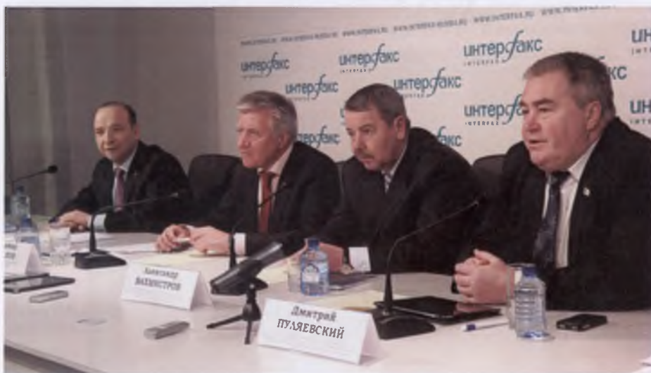
Пресс-конференция, посвященная открытию новых кафедр в Северо-Западном институте управления (декабрь 2013 года)