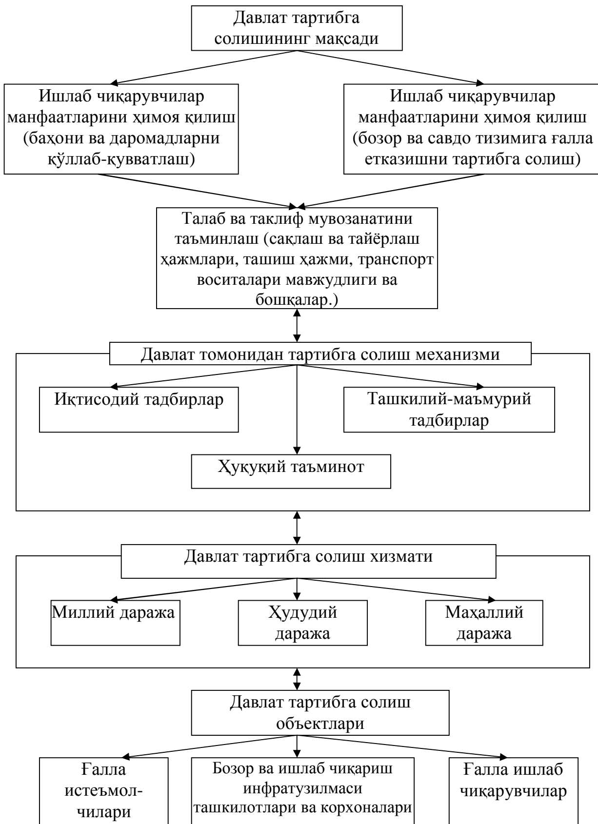
3-чизма. Ғалла бозорини давлат томонидан тартибга солиш механизми.

Ўринни давлатнинг ғалла бозорини тартибга солиши муҳим ўрин тутди. (3-чизма).